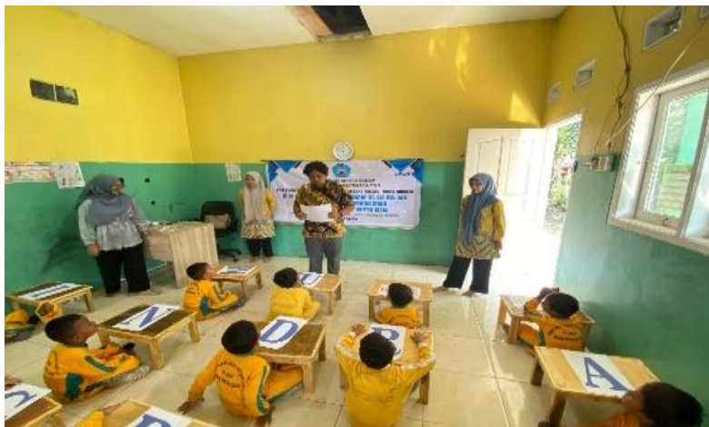
Gambar 3. Siswa menyimak cerita yang diberikan oleh tim PKM Universitas Indraprasta PGRI

Tahap ini berisikan peserta didik dan guru serta kepala sekolah dari TK Khatibul Ilmi menyambut para tim dosen pengabdian masyarakat dengan antusias diiringi dengan nyanyian yang dibawa oleh para siswa dan guru-guru. Tim PKM sangat mengapresiasi dengan memperkenalkan diri kepada siswa di dalam kelas.