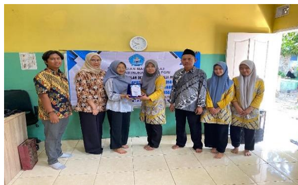
Gambar 5. Tim PKM memberikan cendramata untuk TK Khatibul Ilmi