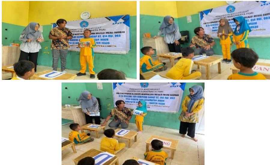
Gambar 4. Siswa dapat mengembangkan keterampilan berbicara dan bercerita dengan media gambar di depan kelas sesuai gambar yang sudah disediakan oleh tim PKM Universitas Indraprasta PGRI

Pada tahapan ini berisikan siswa dapat pengembangan keterampilan berbicara dengan bercerita. Narasi yang diceritakan oleh siswa sesuai gambar yang diberikan oleh tim PKM secara random sesuai pengalaman siswa yang dirasakan sebelumnya atau siswa dapat meningkatkan imajinasi positif. Gambar di atas menunjukkan siswa TK Khatibul Ilmi dengan senang dapat mempraktikkan keterampilan berbicara melalui bercerita dengan gambar yang siswa pilih. Saat mengeksplor ideidnya siswa mulai embangun kepercayaan diri untuk memulai berbicara dan bercerita melauai media gambar siswa dibimbing dan diarahkan oleh tim PKM di depan kelas sesuai kreatifitas, dan menyenangkan.