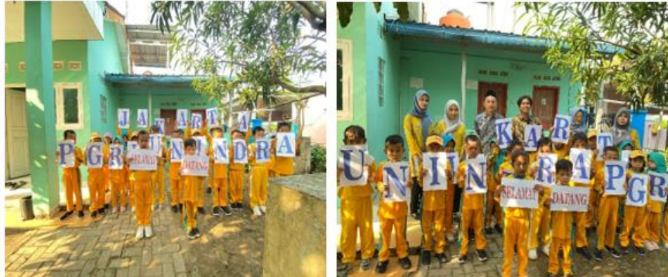
Gambar 2. Siswa dan guru menyambut kedatangan tim PKM Universitas Indraprasta PGRI

Tahap ini berisikan peserta didik dan guru serta kepala sekolah dari TK Khatibul Ilmi menyambut para tim dosen pengabdian masyarakat dengan antusias diiringi dengan nyanyian yang dibawa oleh para siswa dan guru-guru. Tim PKM sangat mengapresiasi dengan memperkenalkan diri kepada siswa di dalam kelas.