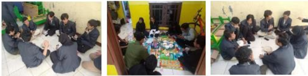
Gambar 2. Mahasiswa merancang proyek yang akan dikerjakan

Hal ini didukung berdasarkan hasil penelitian Suryani di Sulawesi Barat bahwa penerapan model pembelajaran berbasis proyek dilakukan mahasiswa kepada masyarakat tani di wilayahnya. Melalui model pembelajaran berbasis proyek tentunya memberikan dampak positif terhadap mahasiswa yakni (1) mahasiswa dapat menyelesaikan tugas proyek tepat waktu dan tanggungjawab, (2) melatih kemampuan berkomunikasi mahasiswa dengan dosen, tim kerja serta masyarakat (3) mampu melakukan kolaborasi dalam menyelesaikan proyek (4) Meningkatkan kemampuan berpikir kritis dan kreatif terwujud dalam desain program pemberdayaan masyarakat tani berbasis gender, (5) Meningkatkan kepedulian mahasiswa dalam memecahkan permasalahan yang ada (Dewi, 2023).