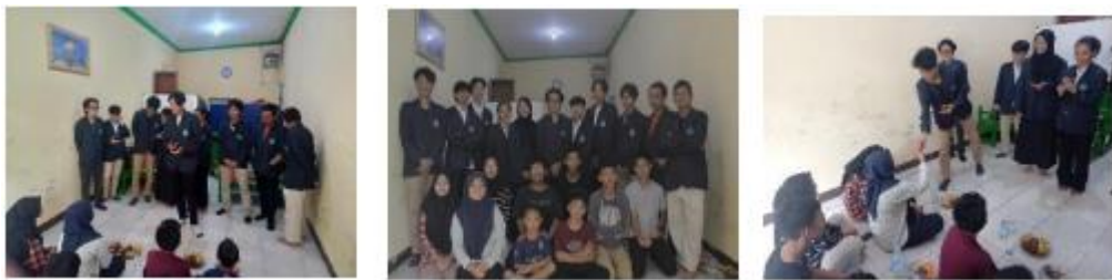
Gambar 1. Mahasiswa menentukan temuan permasalahan di lapangan

Implementasi metode pembelajaran berbasis proyek pada mata kuliah Pancasila di Prodi Teknik Informatika Unindra semester 1, dilakukan langkah-langkah sebagai berikut: 1) Dosen menjelaskan dan menyesuaikan dengan RPS untuk penggunaan metode pembelajaran berbasis proyek, untuk mengangkat tema sesuai yang tercantum pada RPS Pancasila, 2) Dosen membimbing mahasiswa Membuat kelompok dan memilih tema yang menarik untuk mahasiswa membuat proyek, 3) Menentukan proyek yang akan dibuat berdasarkan temuan permasalahan, 4) Melakukan bimbingan dengan dosen tentang hal-hal yang perlu dipersiapkan dalam membuat proyek, 5) Pelaksanaan Proyek di lapangan, 6) Dosen mengevaluasi proyek yang sudah dibuat oleh mahasiswa. Dalam hal ini mahasiswa memaparkan hasil kegiatan proyek di depan kelas.