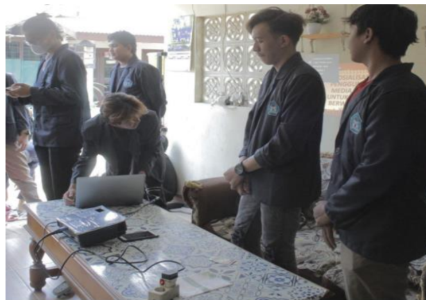
Gambar 3. Mahasiswa pada kegiatan proyek

banyaknya manfaat model pembelajaran berbasis proyek, namun terdapat beberapa kelemahan model pembelajaran berbasis proyek antara lain: 1) membutuhkan biaya, 2) memerlukan waktu yang cukup lama untuk menghasilkan sebuah proyek, 3) membutuhkan fasilitas yang mendukung (Setyowati & Mawardi, 2018). Untuk menangani beragam kelemahan dari model pembelajaran berbasis proyek tentunya, dosen dapat memberikan pengetahuan dan wawasan dengan berdiskusi kepada mahasiswa tentang hal-hal yang harus dihadapi dan dipersiapkan agar dapat terhindar dari kendala yang ada. Dosen dapat memberikan penjadwalan kepada mahasiswa tentang pembelajaran proyek agar mahasiswa mampu disiplin terhadap waktu yang diberikan. Serta mahasiswa mampu mempersiapkan dari segi biaya dan mempersiapkan lebih matang fasilitas yang dibutuhkan untuk didiskusikan dengan dosen terlebih dahulu agar kegiatan proyek ini dapat berjalan dengan hasil maksimal.